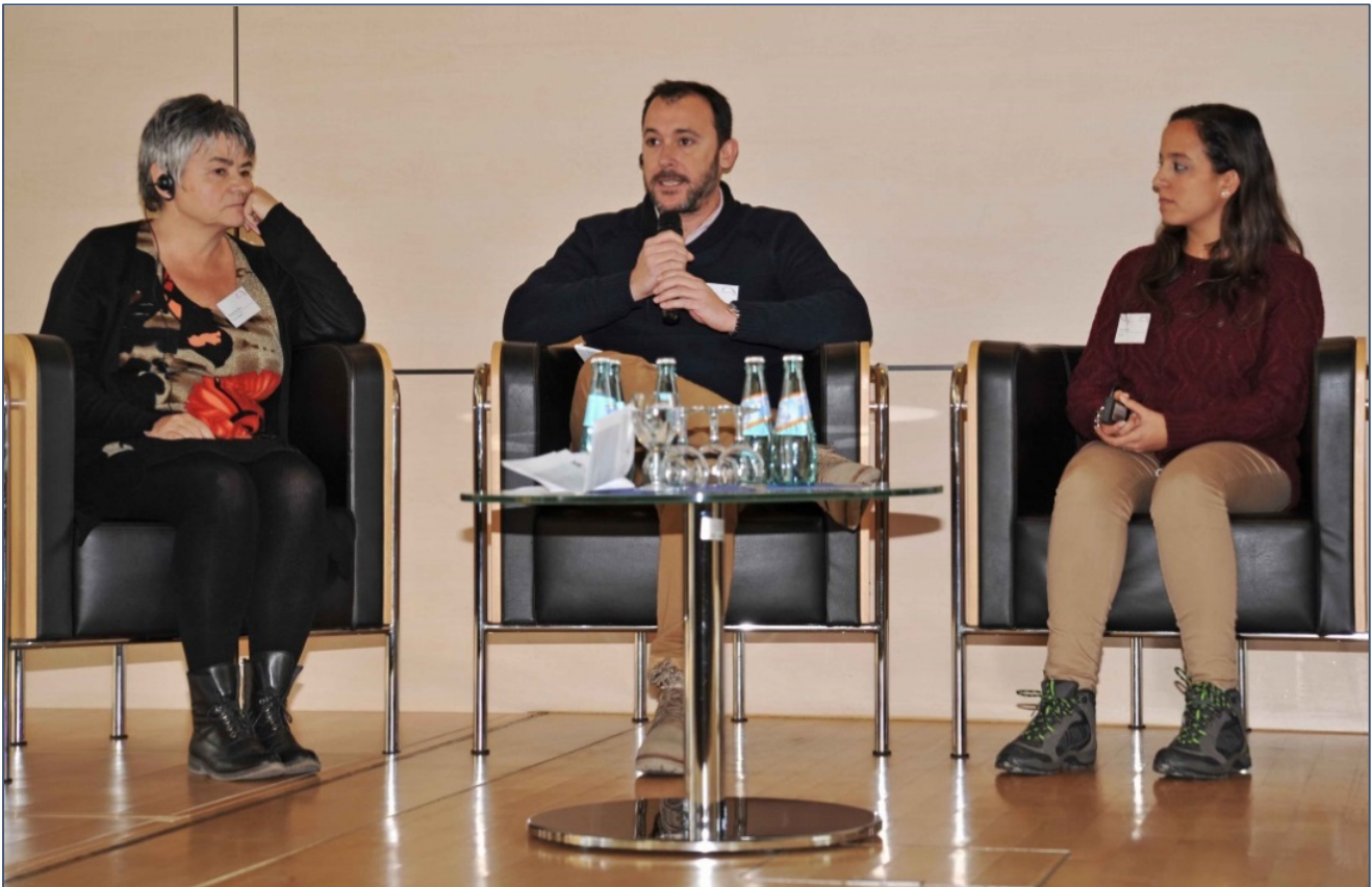
Encima del podio los socios de alemania y españa charlando.