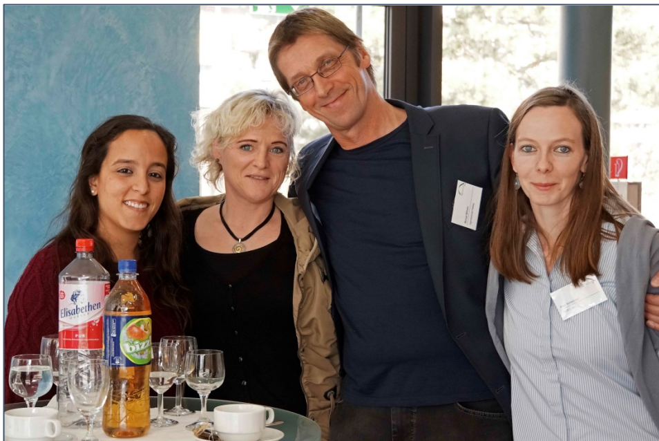
Público profesional transnacional durante el descanso