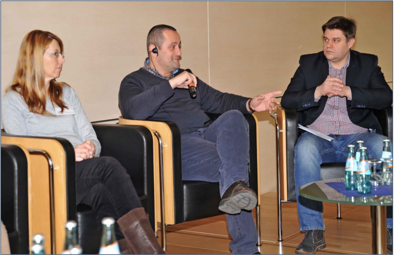
El socio de Malta informa sobre su red en la isla.