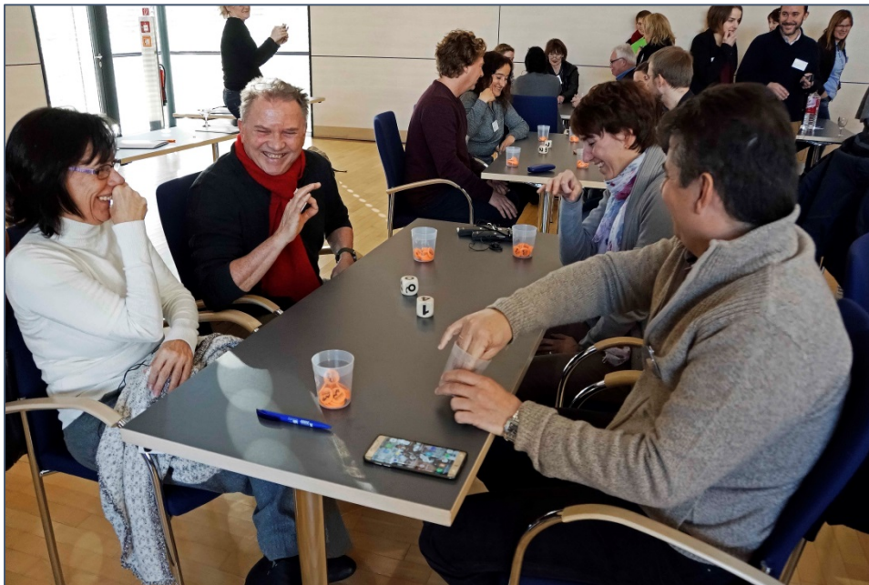
Los invitados haciendo un ejercicio intercultural "KultuRallye"