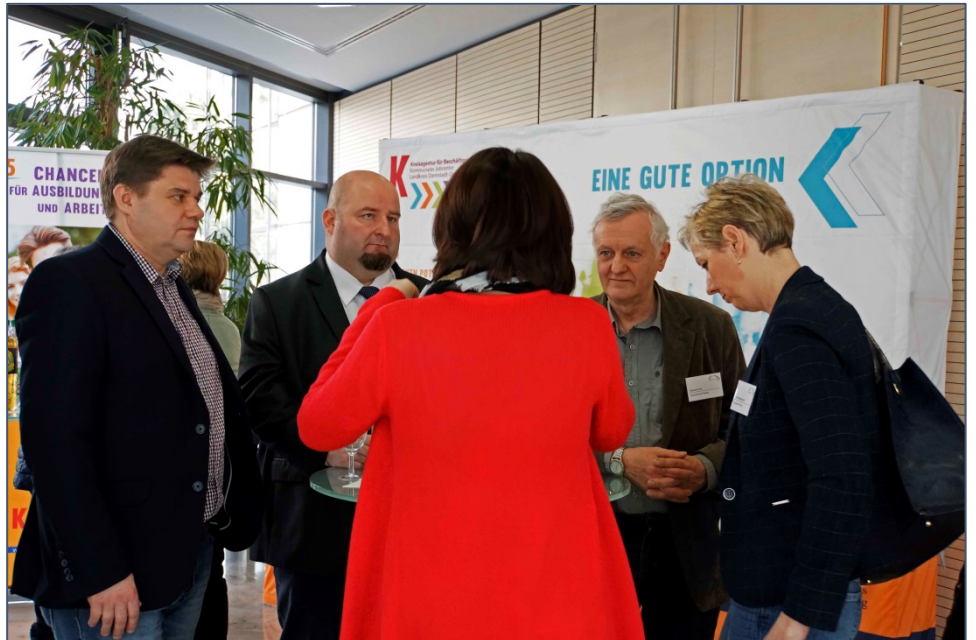
Socio del proyecto transnacional de polonia en una charla