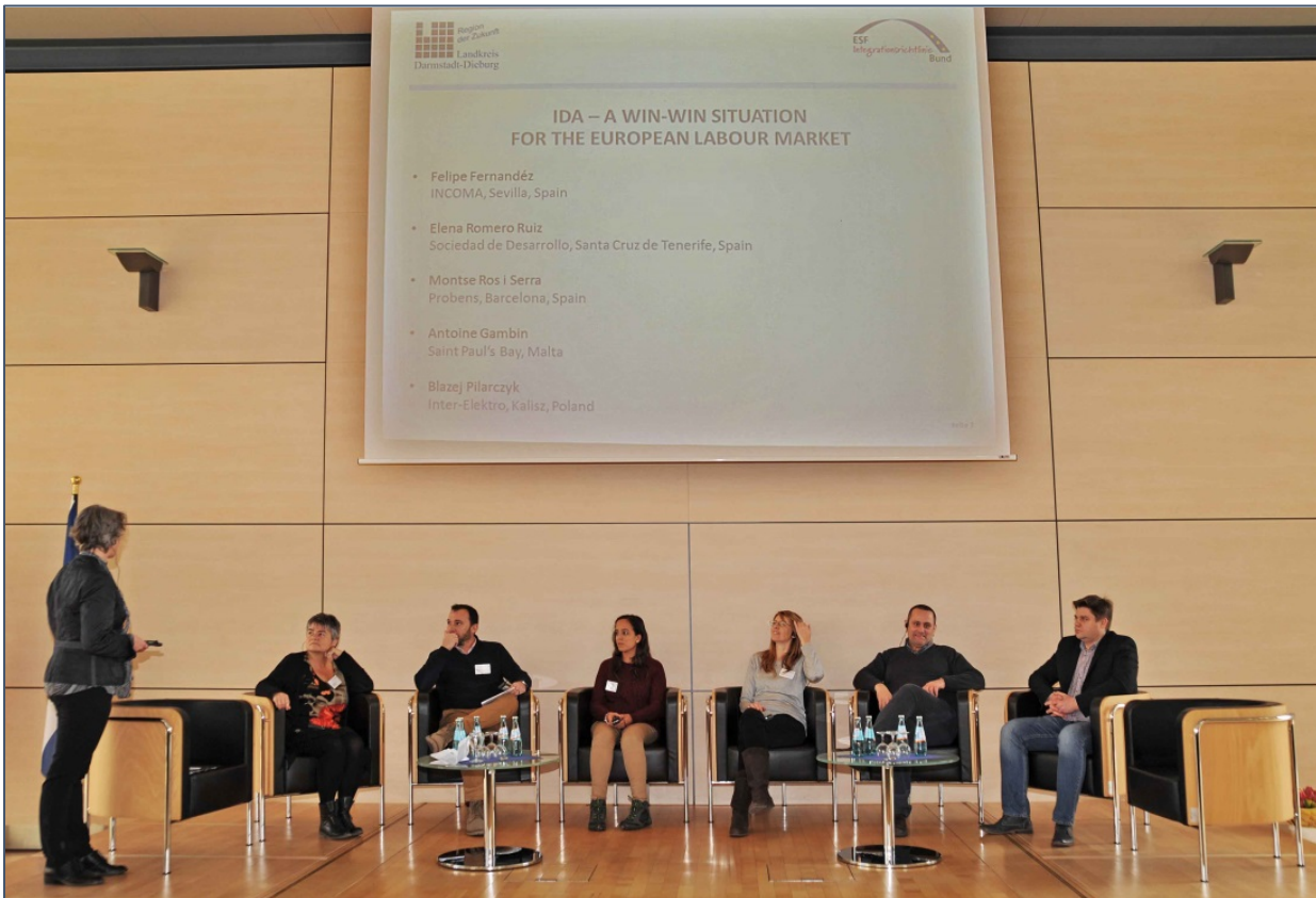
Entrevista sobre el podio con socios internacionales