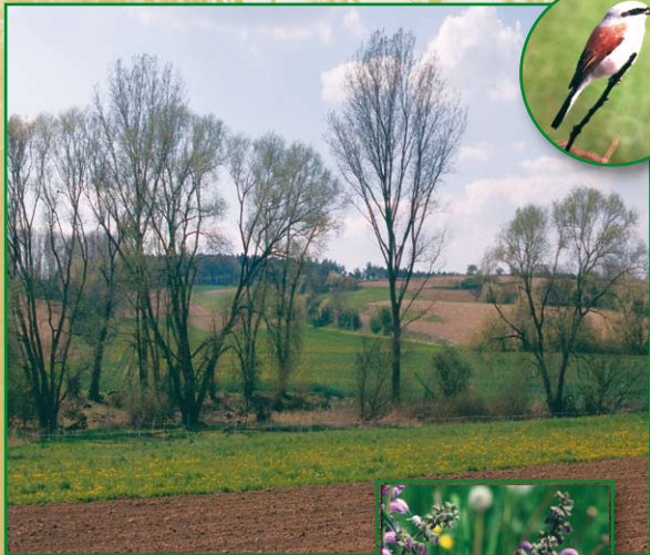
Das Tal des Schlierbaches. Heimat für eine Vielzahl von Tier- und Pflanzenarten.