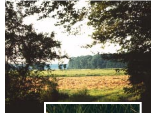
Blick auf den Mittelforst über das Semmetal