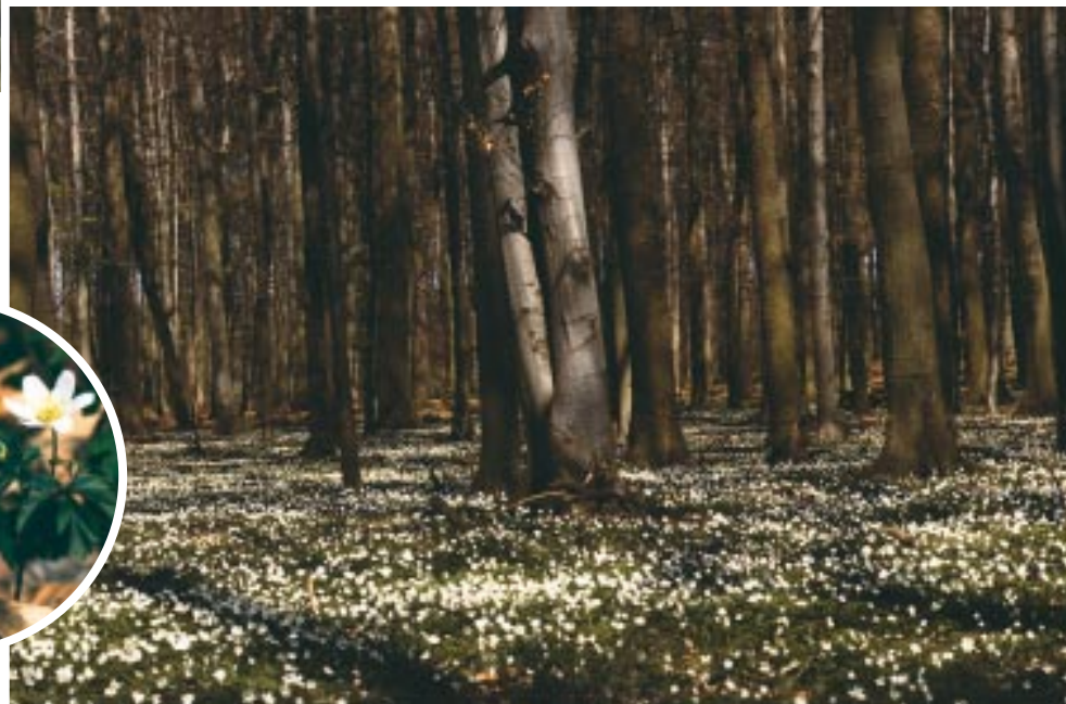
Buchenwald im Frühling mit Buschwindröschen-Flur