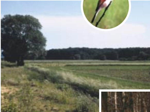
Der Rödergrund mit Blick nach Norden auf den Lützelforst