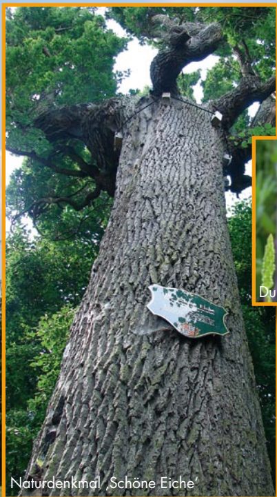
Naturdenkmal „Schöne Eiche“

Nur selten wird die Ruhe der Landschaft durch einen vorbeirauschenden Zug, ein Auto, ein Flugzeug oder durch andere Zivilisationsgeräusche gestört. Bänke an einigen Stellen laden zum Verweilen ein und erlauben eine beschauliche Naturbeobachtung. Ein Abstecher nach Babenhausen, mit seiner historischen Altstadt und dem Schloss, bietet sich als reizvolle Ergänzung zu dieser Tour an. Verschiedene Einkehrmöglichkeiten runden das Angebot ab.