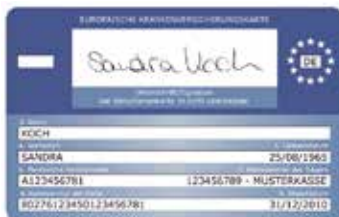
Muster einer Gesundheitskarte (Rückseite)

پزشک مستقیماً با بیمه سلامتی تصفیه حساب میکند.