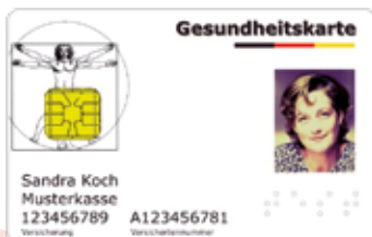
Muster einer Gesundheitskarte (Vorderseite)

Der Arzt rechnet dann direkt mit der Krankenversicherung ab.