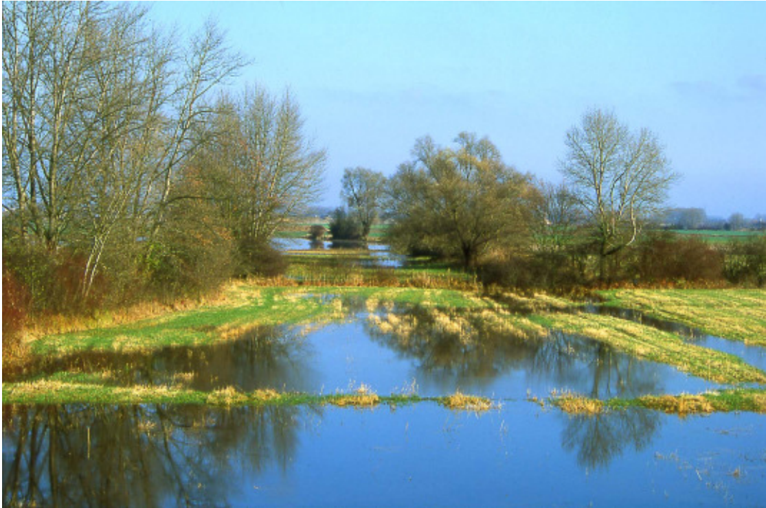
Abb. 4 Die Wiesenlandschaft des NSG und FFH-Gebietes „Riedwiesen von Wächterstadt“ in der Altaue des Rheins wird regelmäßig durch Druckwasser oft wochenlang überflutet. Dies ist auch der Grund dafür, dass trotz großer Bestände des Echten Haarstrangs nur eine geringe Besiedelung mit der Haarstrangwurzeleule festgestellt werden konnte. Gut zu sehen ist ein ausgeprägtes Mikorelief. An Grashalmen abgelegte Eier, die aus dem Wasser herausragen, sind vor Überflutung sicher Foto: H. Zettl, Dez. 2002

Zur Dezimierung der Populationen der Haarstrangwurzeleule können auch Wildschweine beitragen, die nach Raupen und Puppen wühlen und mitunter eine ganze Wiese umbrechen können. Die indirekten Folgen des Wildschweinwühlens können sogar noch schädlicher für eine Population sein, als die Dezimierung durch die Wildschweine selbst, wenn nämlich die Grasnarbe durch die Bewirtschafter wieder glatt gezogen wird. Dies geschieht i. d. R. im zeitigen Frühjahr, wenn sich die Haarstrangwurzeleule noch im Eistadium befindet. Das Fräsen der Grasnarbe kann dann zum Erlöschen einer lokalen Population führen, wenn die gesamte Wiese in dieser Weise behandelt wird. Zum Schutz der Vorkommen der Haarstrangwurzeleule wäre das Schwarzwild daher dringend auf einen vertretbaren Bestand zu halten.