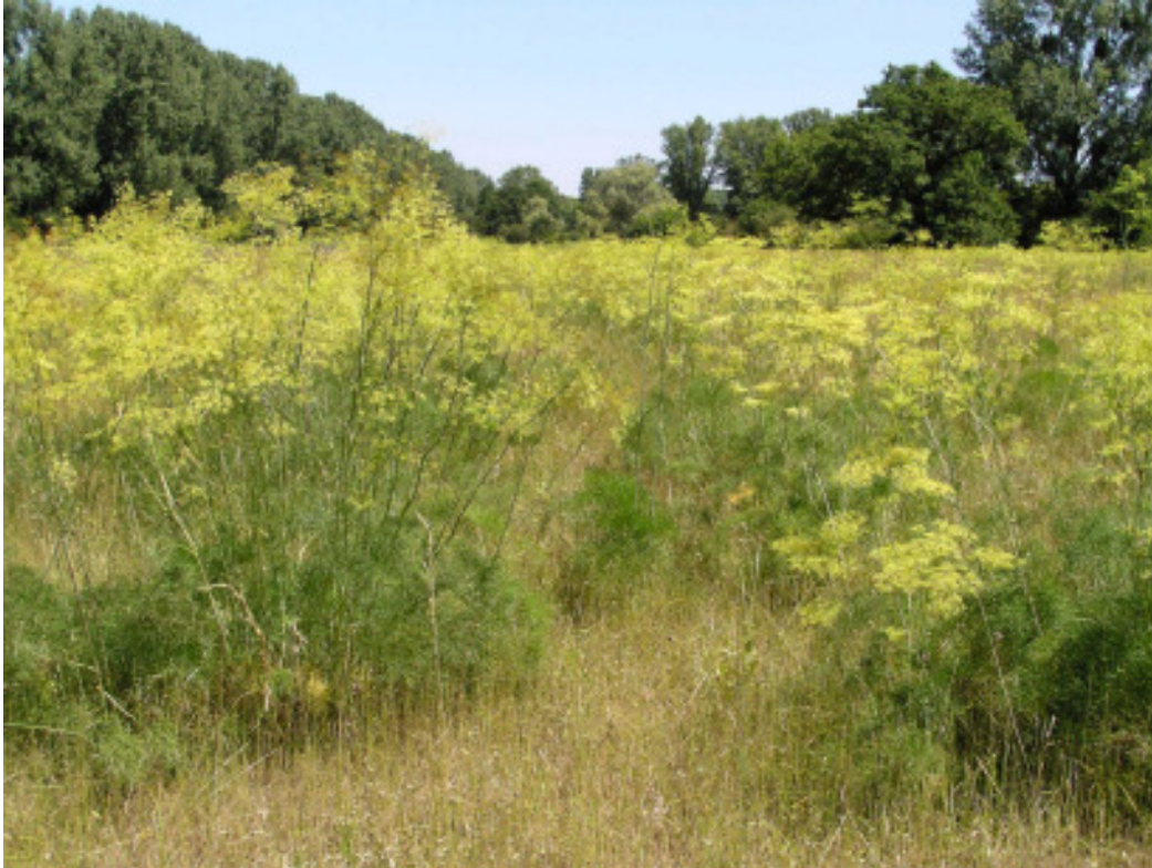
Abb. 1 Lebensraum der Haarstrangwurzeule mit üppigen Beständen des Echten Haarstranges im FFH-Gebiet „Kühkopf-Knoblochsau“.