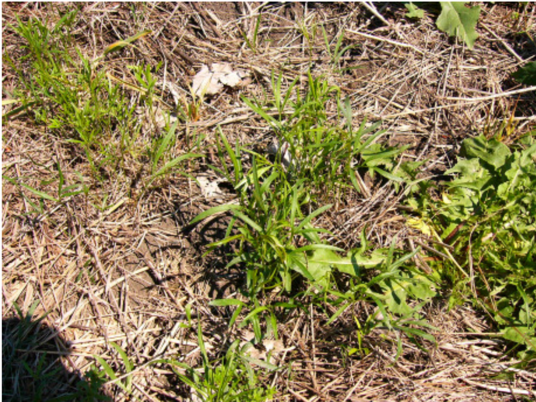
Abb. 6 Keimende Haarstrang-Pflanzen auf neu geschaffenem Auengrünland in Riedstadt im Rahmen des E + E-Projektes der UNI Gießen Foto: M. Ernst, Juni 2004

Die Deichsanierung spart in der Regel die wasserseitigen, westexponierten Böschungen aus, wenn diese nicht zu steil sind. So blieben auch einige von der Haarstrangwurzeleule besiedelte Deichabschnitte trotz Deichsanierung erhalten. Hierdurch besteht die Hoffnung, dass sich die Deich-Populationen nach abgeschlossener Sanierung wieder erholen können.