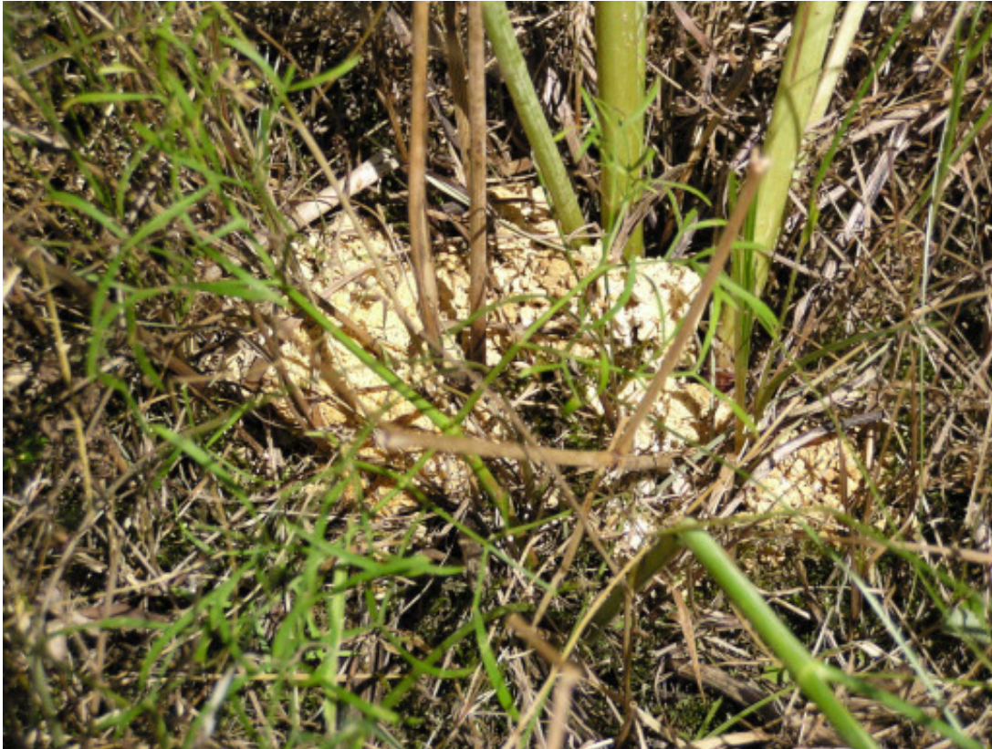
Abb. 2 Durch die Raupe der Haarstrangwurzeleule erzeugte Bohrmehlauswürfe an der Stängelbasis des Echten Haarstranges

Neben der Kontrolle der Raupenfutterpflanze und dem Auszählen der befallenen Pflanzen mit Bohrmehlhäufchen, erfolgte zusätzlich eine Kontrolle der Imagines mit Hilfe des Lichtfangs und dem Ableuchten der Vegetation mittels eines Handstrahlers. Hierdurch entstanden relativ genaue Verbreitungsmuster und Eindrücke von der Populationsgröße der Art in Südhessen. Das Ableuchten der Lebensräume erbrachte darüber hinaus auch Erkenntnisse über das Verhalten der Tiere im Lebensraum.