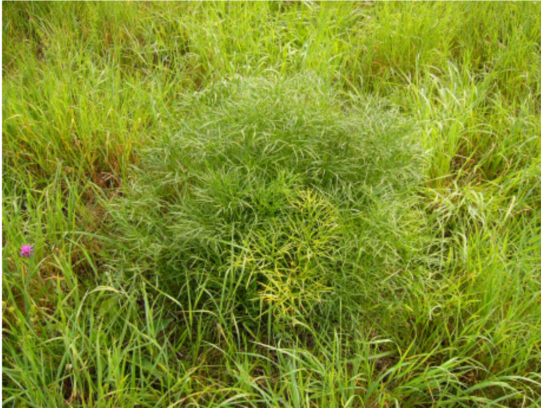
Abb. 1 Von der Haarstrangwurzeleule befallene Haarstrangpflanzen sind in vielen Fällen durch absterbende Blätter kenntlich

Die Anwesenheit der Haarstrangwurzeleule ist leicht durch die von ihrer Raupe erzeugten Bohrmehlauswürfe an der Stängelbasis der befallenen Haarstrang-Pflanzen zu erkennen. In der Regel fallen die Pflanzen bereits durch gelbe Blätter von weitem auf.