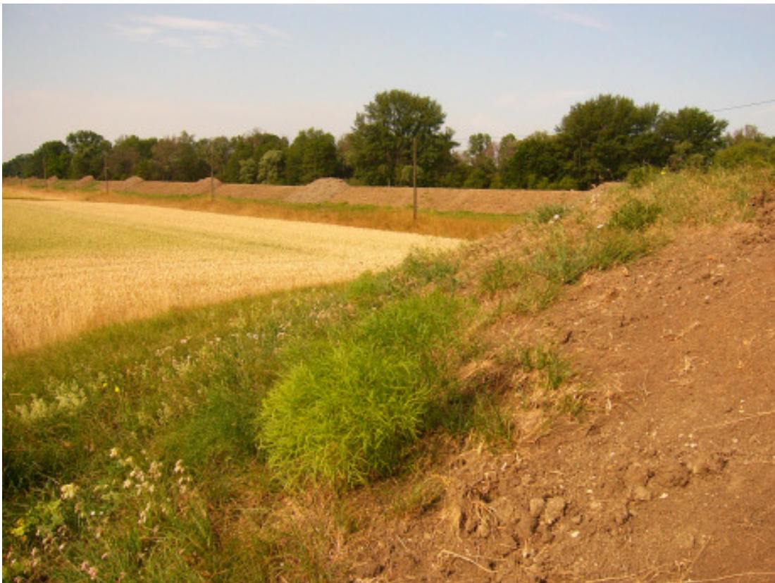
Abb. 3 Durch das Sofortprogramm teilsanierter Rheinwinterdeich bei Trebur. Die Wasserseite des Deiches blieb an vielen Deichabschnitten unangetastet, die Landseite wurde zunächst im oberen Drittel verstärkt. Ein Teil der Haarstrang-Pflanzen blieb von den Baumaßnahmen verschont. An diesen Pflanzen konnte noch während der Bauarbeiten die Haarstrangwurzeleule nachgewiesen werden.

verschärft hat. So ist die stärkste Population an dem Deich bei Astheim, Kreis Groß-Gerau, die viele hundert Individuen umfasste durch die Bauarbeiten stark zusammengeschrumpft. Der Individuenaustausch lokaler Populationen ist aber wichtig, um das Überleben der Art langfristig zu sichern. Eine Verbindung der beiden Metapopulationen südliches hessisches Ried und nördliches hessisches Ried besteht bereits nicht mehr. In früheren Zeiten hat sich die Vegetation nach solchen Eingriffen rasch wieder regenerieren können, da artenreiches Grünland in ausreichendem Umfang in Kontakt mit den Deichen stand. Darüber hinaus erfolgte die Einsaat der Deiche mit autochthonem Saatgut. Heute sind die Eingriffe bei der Deichverstärkung deutlich tiefgreifender für Fauna und Flora. In kurzer Zeit werden große Abschnitte der Winterdeiche bearbeitet. Da artenreiches Grünland äußerst selten ist, findet eine Rückbesiedelung autotypischer Tier- und Pflanzenarten aus den Rheinauen kaum oder nicht mehr statt. Die Einsaat erfolgt heute mit handelsüblichem Saatgut. Haarstrangsamens befindet sich nicht darunter, sodass diese Pflanze aus vielen Landschaftsteilen im hessischen Ried bereits verschwunden ist.