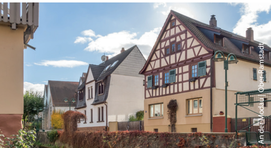
An der Modau | Ober-Ramstadt

Das Land Hessen und der Landkreis Darmstadt-Dieburg haben einiges auf den Weg gebracht, um Ortskerne zu stärken: Die Programme zur Dorfentwicklung, Städtebauförderung, kommunale Anreize und Regionalentwicklung bieten aktuell die wichtigsten Fördermöglichkeiten für private Bauinteressierte.