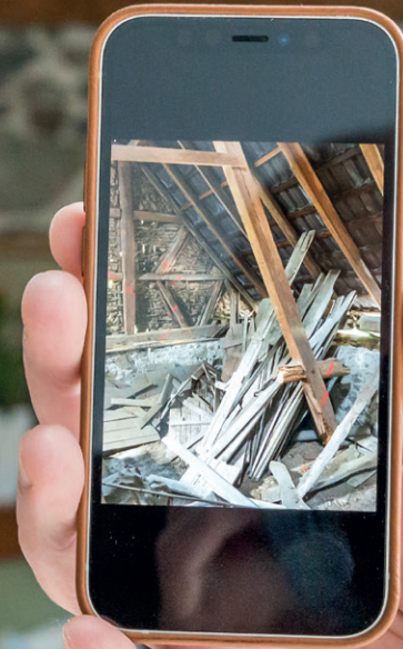
Historische Scheune | Waschenbach