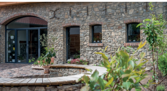
Einzel aufbereitet und wiederverwendet: Die Pflastersteine im Hof stammen von einer alten Otzberger Straße.

„Lieben Dank an unsere tollen Nachbarn, die unsere Baumaßnahmen so geduldig ertragen haben!“