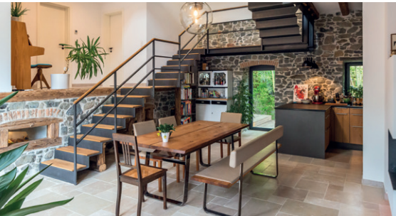
Die Stahltreppe, das verbindende Element – aus 8 mm gekantetem Stahlblech konstruiert.