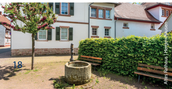
Alices Rathaus | Hergershausen

Information ist Geld wert! Fragen Sie Ihre Fachabteilung Bauen in der Gemeindeverwaltung, ob die Gemeinde ein Förderschwerpunkt für Dorfentwicklung oder für Städtebauförderung ist. Manche Kommunen bieten auch eigene finanzielle Anreize für Bauen im Bestand.