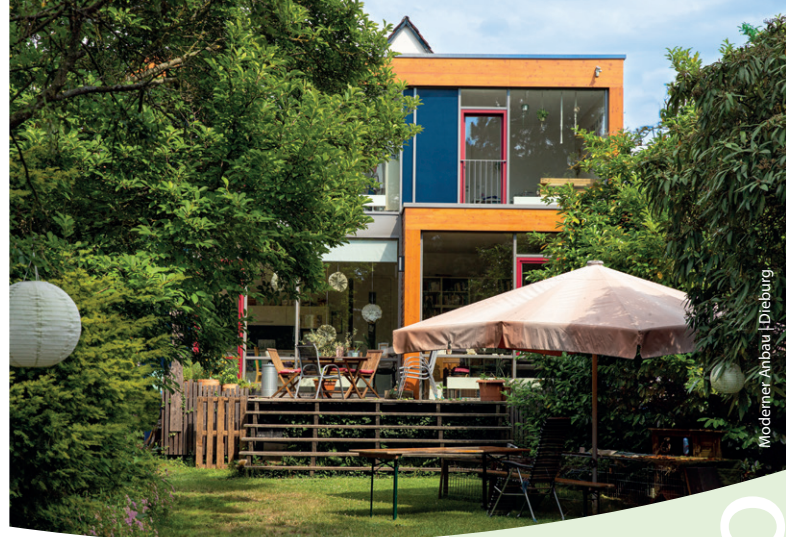
Modernier Anbau Drieburg