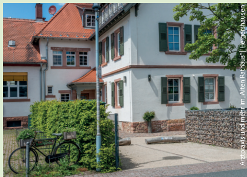
Arztpraxis und mehr | im „Alten Patzhaus“ | Hegerhausen