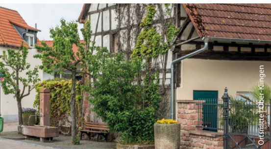
Ortsmitte | Ober-Klingen