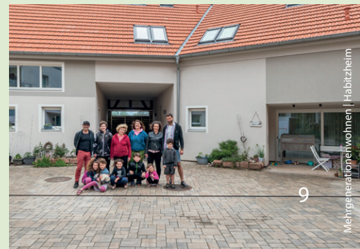
Mehrgenerationenwohnen | Habitzheim