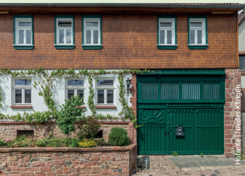
Hotellerie | Nieder-Klingen