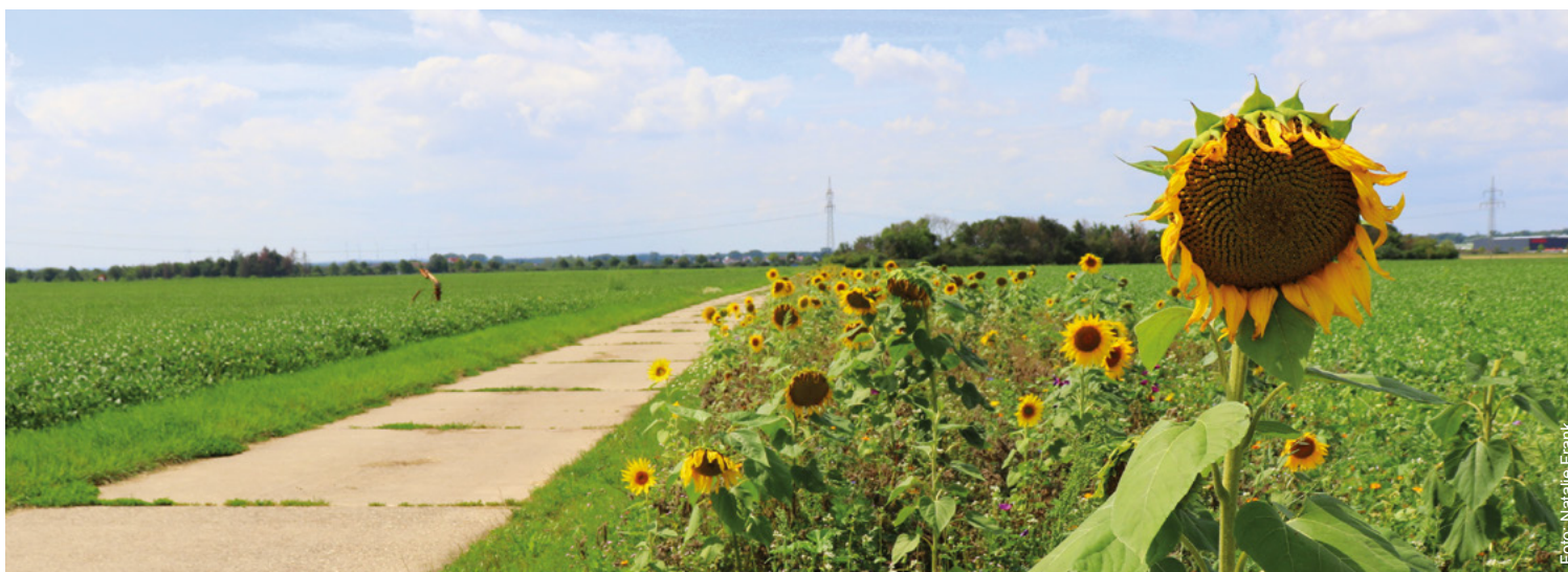
Stockstadt am Rhein

Heimatmuseum Crumstadt Poppenheimer Straße 3, 64560 Riedstadt-Crumstadt geöffnet jeden 2. Sonntag im Monat 10 bis 12 Uhr und nach Vereinbarung