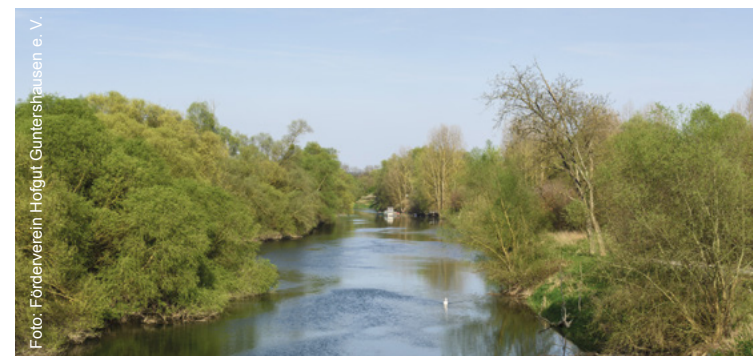
Stockstadt am Rhein

Museum der Gemeinde Stockstadt im Hofgut Guntershausen geöffnet von März bis Oktober: Samstags, sonntags und an Feiertagen von 13 bis 17 Uhr www.hofgut-guntershausen.de