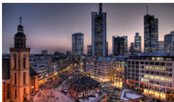
夜幕中的法兰克福天际线建筑：美茵大都会的圣名菲声德国，享誉世界。