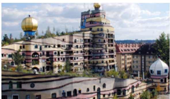
位于达姆施塔特国民公园区的螺旋森林是按照艺术家佛登斯列·汉德瓦萨的设计而建造的。