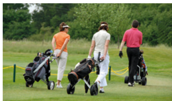
另外，高尔夫球可能在该区域。