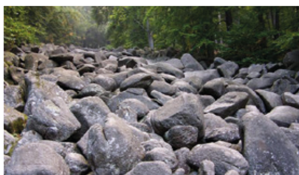
劳特塔尔的岩砾海是贝格施特拉塞—奥登瓦尔德山世界地质公园。