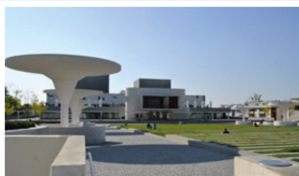
达姆施塔特全新翻修过的国家大剧院闪耀着崭新的光芒并上映有许多有趣的戏剧。