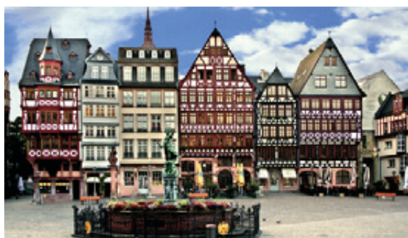
法兰克福旧市政厅和天际线建筑一样属于 法兰克福的标志。