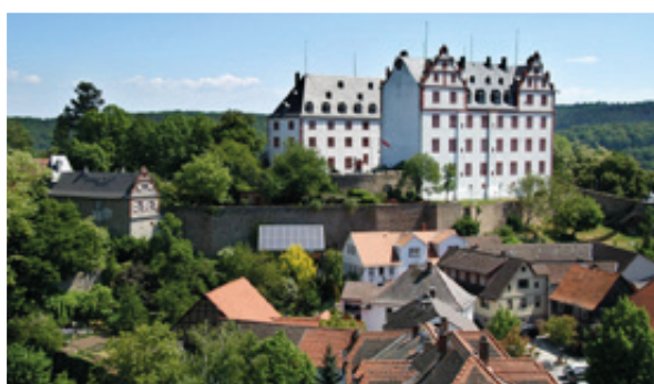
菲施巴塔尔的利希滕贝格宫殿最初是作为 城堡建于12 世纪并在那以后得到改建。