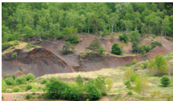
曼塞尔坑一眼望去并不引人注目，但它却是全世界独一无二的化石宝藏。