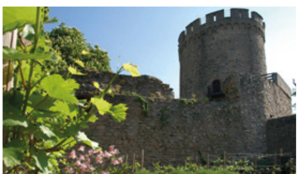
Das Alsbacher Schloss, auch als Bickenbacher Burg bekannt, bietet einen hervorragenden Blick auf die Bergstraße.