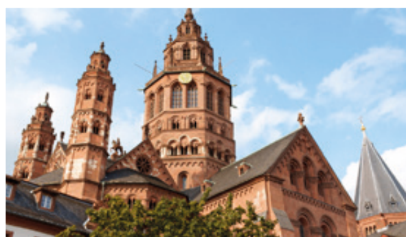
Der Hohe Dom zu Mainz besteht aus romanischen, gotischen und barocken Bauelementen.

In der Region um Frankfurt, Mainz, Wiesbaden, Offenbach, Darmstadt und Heidelberg kommen sowohl Erholungssuchende als auch Aktive voll auf ihre Kosten.