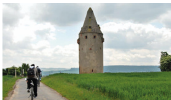
Der Schaafeheimer Wartturm wurde bereits 1492 errichtet und diente zur Sicherung von Fuhr- und Kaufleuten.