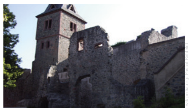
Ruinen der berühmten Burg Frankenstein, die seit Jahren Europas größtes Halloween-Fest beheimatet.