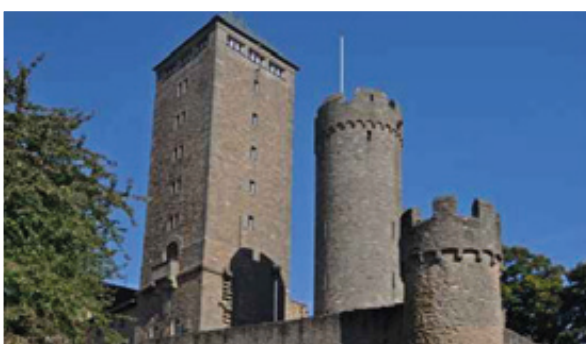
Die Starkenburg in Heppenheim verlieh der ehemaligen südhessischen Provinz ihren Namen.