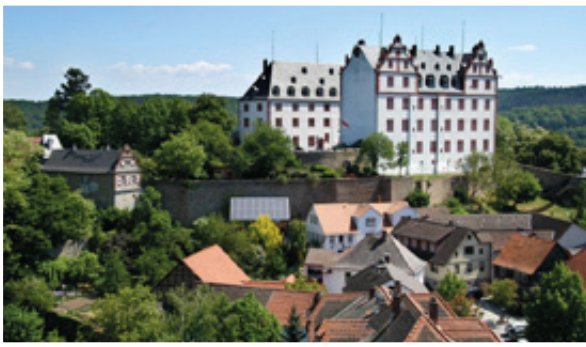
Das Schloss Lichtenberg im Fischbachtal wurde zunächst als Burg im 12. Jahrhundert errichtet und später umgebaut.