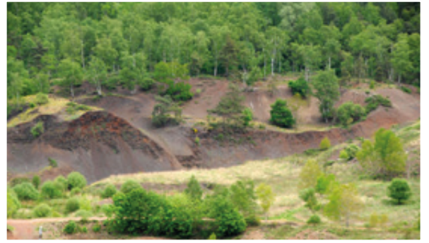
Die Grube Messel sieht auf den ersten Blick unscheinbar aus - doch sie ist ein weltweit einmaliger Schatz für Fossilien.