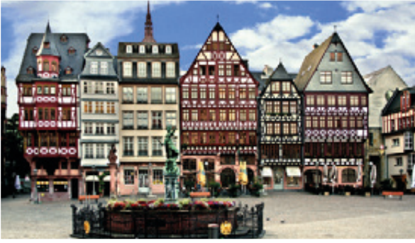
Der Römer gehört genau wie die Skyline zu den Wahrzeichen von Frankfurt.