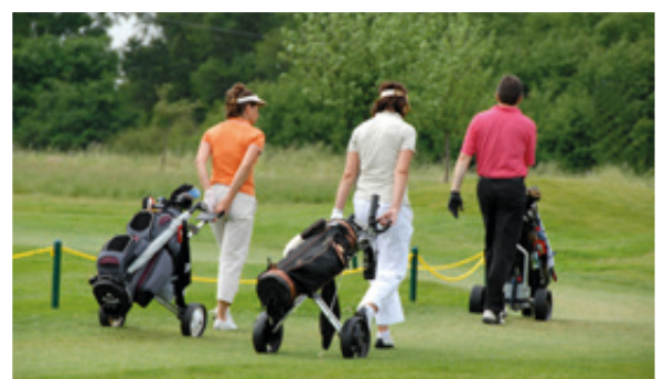
Auch das Golfen ist in der Region möglich.