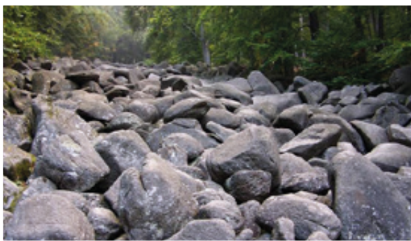
Das Felsenmeer im Lautertal ist eines der Highlights im Geo-Naturpark Bergstraße-Odenwald.