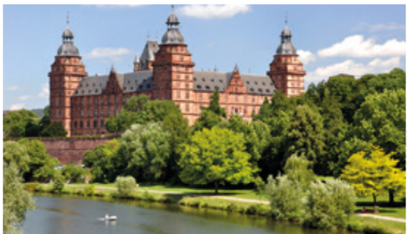
Direkt am Main liegt das Schloss Johannisburg in der unterfränkischen Stadt Aschaffenburg.