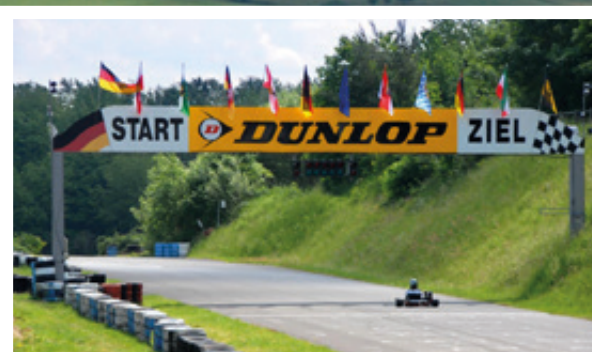
Drehen Sie ein paar Runden im Kart - entweder in Schaafeheim oder in Groß-Zimmern.