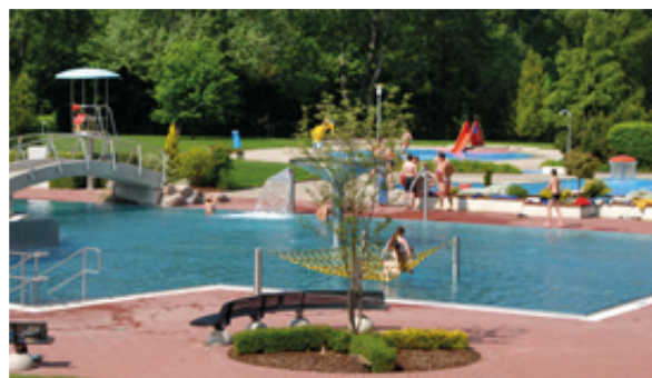
Die vielen Schwimmbäder im Landkreis Darmstadt-Dieburg laden zum Schwimmen und Erholen ein.