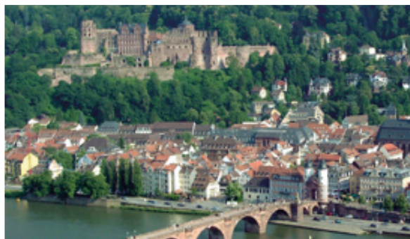
Das Heidelberger Schloss und die historische Altstadt gehören zu den schönsten in Deutschland.

Ebenso elegant und formschön wie die Heidelberger Altstadt strahlt das Aschaffener Schloss in roter Farbe und mit seinen vier charakteristischen Ecktürmen. Der Mainzer Dom besticht nicht nur allein durch seine Größe, sondern durch viele architektonische Formen. Im Laufe der Jahrhunderte kamen immer wieder Anbauten hinzu, daher besteht der Dom sowohl aus romanischen als auch aus gotischen und barocken Elementen.