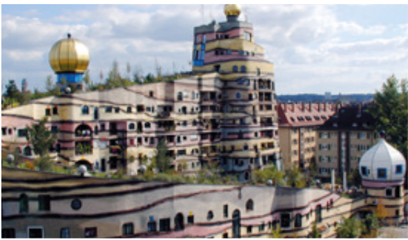
Die Waldspirale im Darmstädter Bürgerparkviertel wurde nach einem Entwurf des Künstlers Friedensreich Hundertwasser gebaut.