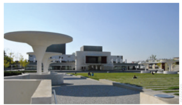
Das komplett sanierte Staatstheater in Darmstadt erstrahlt in neuem Glanz und zeigt viele interessante Theaterstücke.