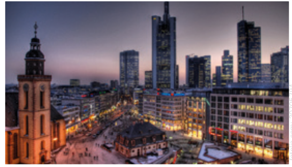
Die Frankfurter Skyline in der Dämmerung: Das Nachtleben der Main-Metropole ist weit über Deutschlands Grenzen hinaus bekannt.