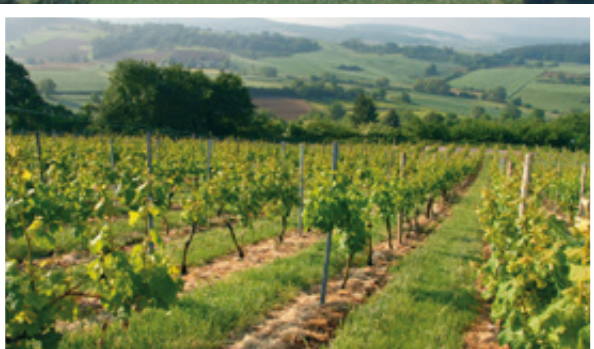
Auf dem Weinlehrpfad in Groß-Umstadt können auch viele Kenner noch einiges über den Anbau von erstklassigen Weinen lernen.