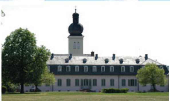
"Kleinod des Rokoko", so wird das Schloss Braunshardt auch genannt. Die farbenprächtigen Räume sind immer ein Besuch wert.