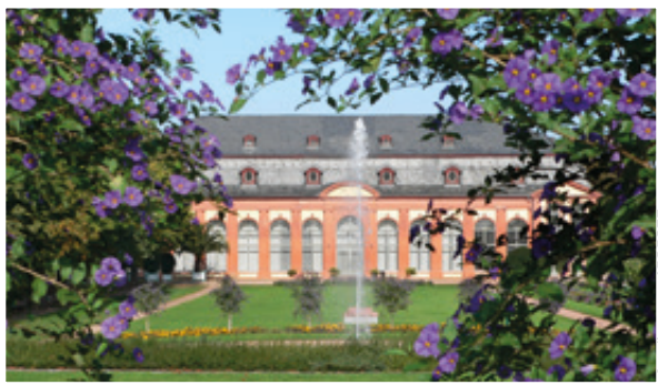
Das kleine Schlösschen in der Orangerie in Darmstadt wird vor allem für Konzerte, Tagungen und private Veranstaltungen genutzt.