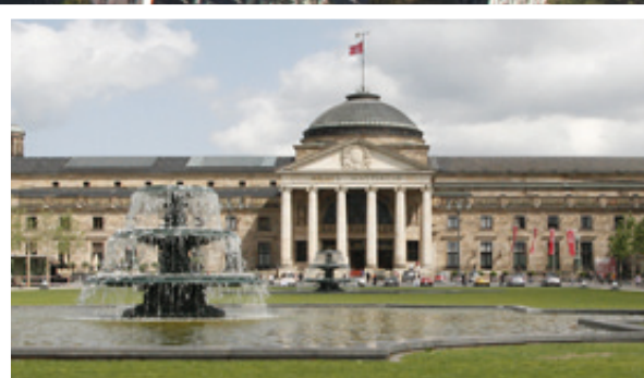
Das Wiesbadener Kurhaus hat mit 129 Metern die längste Säulenhalle Europas und ist gesellschaftlicher Mittelpunkt der Stadt.