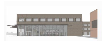
Perspektive Eingangsbereich außen, Stand Juli 2023

Die Planungen in der Leistungsphase 3 werden weiterhin fortgeführt. Die Planungsbüros pflegen zu einem festgelegten Termin ihre Leistungen in das gemeinsame BIM-Model (Building Information Modeling) ein. Hierdurch können frühzeitig Kollisions- und Konfliktpunkte bei der Zusammenführung der einzelnen Fachplanungen ausgemacht und beseitigt werden. Die Beauftragung eines Planungsbüros für die Fachräume steht noch aus, da hierfür bisher noch kein geeignetes Fachplanungsbüro gefunden werden konnte.