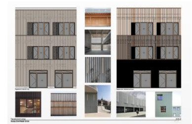
Variantenstudie Fassade, Stand Sept. 2023

Die Planungen am und im Gebäude laufen parallel zur Klärung der Standortfrage im Wesentlichen weiter. Die Planungen, die die Gebäudegründung bzw. die Außenanlagen betreffen, sind bis zur Klärung der Standortfrage ausgesetzt.