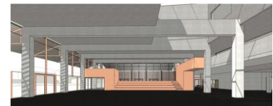
Perspektive Eingangsbereich innen, Stand Juli 2023