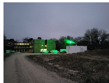
Baustelle mit Bauwatch-Beleuchtung und laufender Heizung