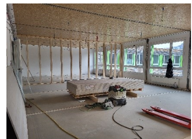
Ausbau im 2. OG

Die Arbeiten an die Außenanlagen sollen im 2. Quartal 2024 beendet werden, so dass mit der Gebäudeausstattung ab 06/2024 begonnen werden kann. Die Inbetriebnahme des Gebäudes ist für nach den Sommerferien 2024 geplant.